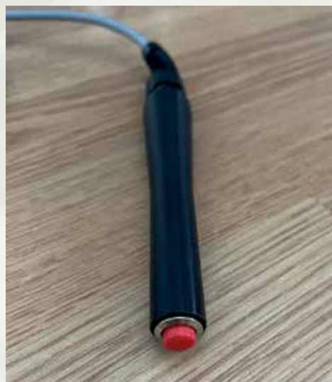
Pulsante di emergenza

La chiusura "velcro" consente una perfetta regolazione sugli arti, anche in soggetti di stature e peso diversi.